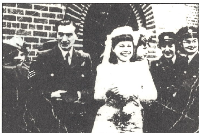
NOVOMANŽELÉ ŠUMOVÍ - ANGLIE 1944