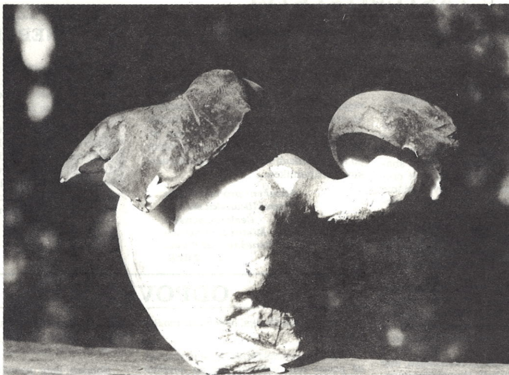
V okolí Benešova letos zatím moc hub nerostlo, ale zato rostly zajímavě.