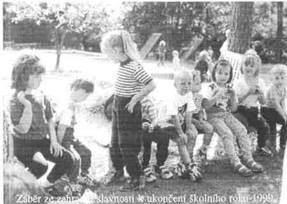
Záběr ze zahradní slavnosti k ukončení školního roku 1999