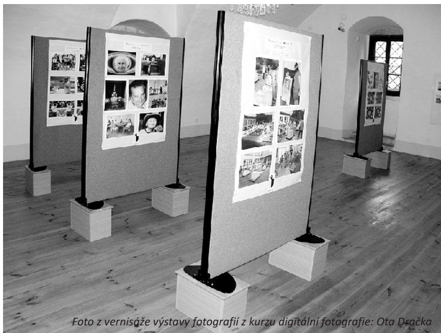
Foto z vernisáže výstavy fotografií z kurzu digitální fotografie: Ota Dračka

Město Benešov nad Ploučnicí, Státní zámek Benešov nad Ploučnicí a partnerské město Heidenau pořádají od 1. 9. 2012 ve výstavních prostorách Horního zámku výstavu fotografií, které byly vytvořeny v rámci mezinárodního projektu Přátel. Jednou z částí projektu, zaměřeného na mezinárodní spolupráci seniorů, byl vzdělávací kurz práce s digitální fotografií. Se-nioři z obou partnerských měst zpracovali dvě témata: Moudrost stáří a Moje rodina a přátel.