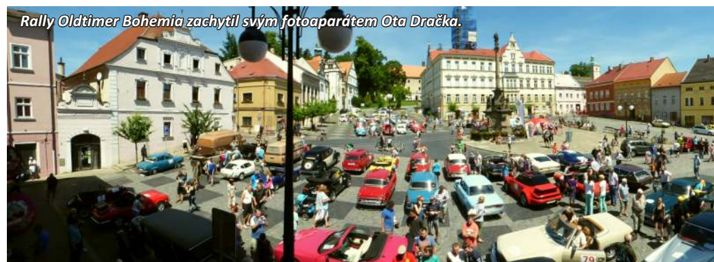
Rally Oldtimer Bohemia zachytil svým fotoaparátem Ota Dračka.