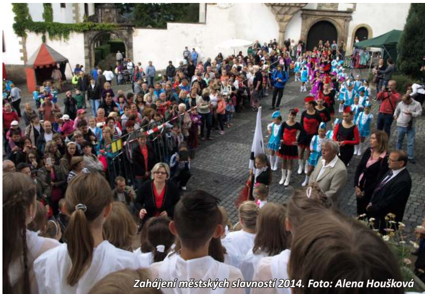
Zahájení městských slavností 2014.