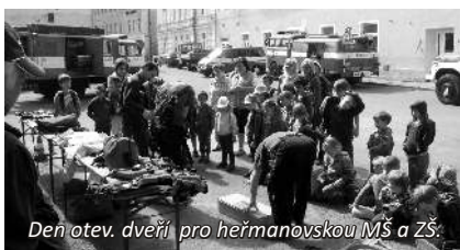
Den otev. dveří pro heřmanovskou MŠ a ZŠ.