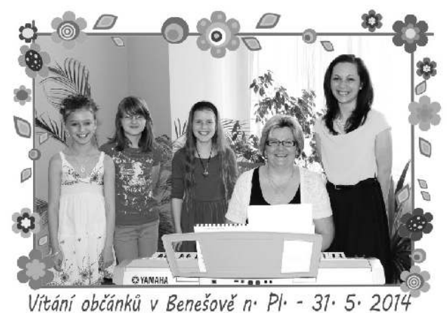
Vítání občánek v Benešově n. Pl. - 31. 5. 2014