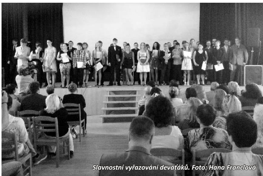
Slavnostní vyřazování devětáctáků.