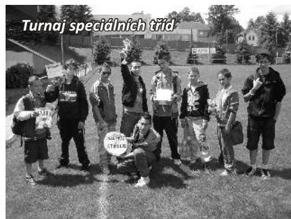
Turnaj speciálních tříd