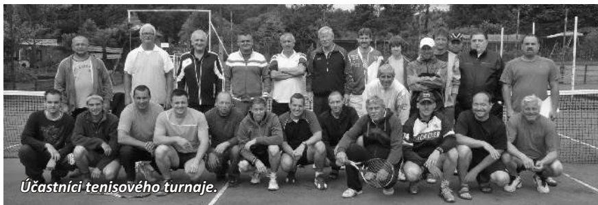
Účastníci tenisového turnaje.