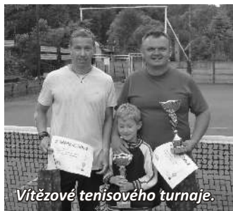
Vítězové tenisového turnaje.