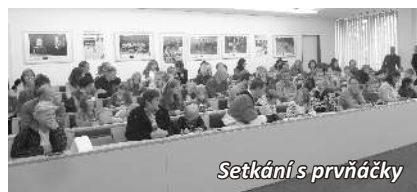
Setkání s prvňáčky