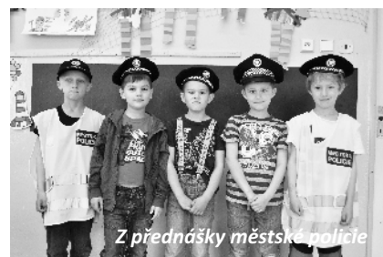
Z přednášky městské policie