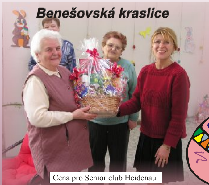
Cena pro Senior club Heidenau