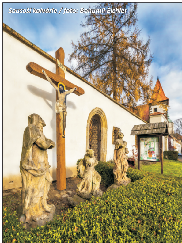
Sousoší kalvárie