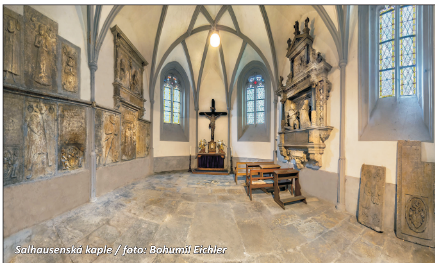
Salhausenská kaple

(Tento text byl použit jako průvodní text k přihlášce do soutěže o Historické město roku 2015)