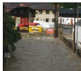
Z viaduktu na Habartice