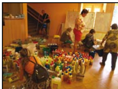
Pomoc v kině