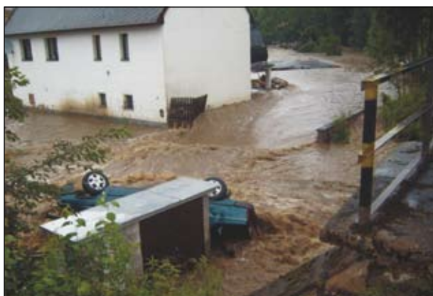
Ulice Boženy Němcové