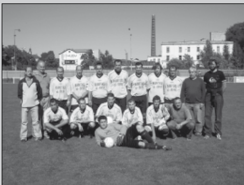
Vítězové okresního přeboru 2008/2009