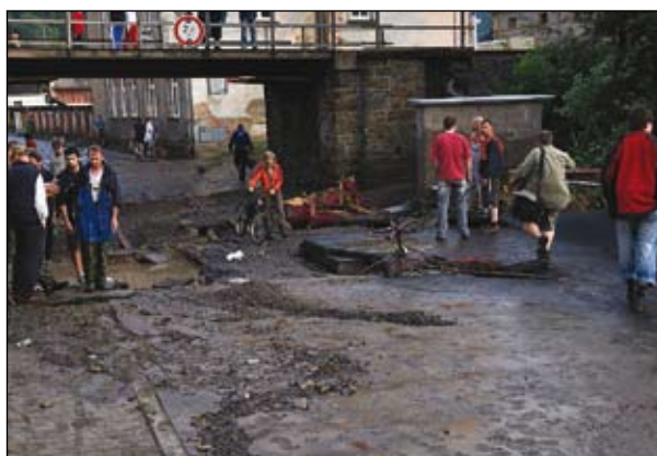
Ulice Boženy Němcové