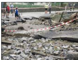
Křižovatka ulic Žižkova a Palackého