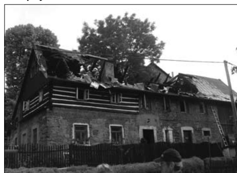
Postižený objekt ve Valkeřicích, u kterého zasahovala jednotka SDH Benešov nad Ploučnicí.