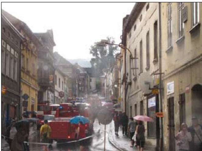
Ulice Československé armády