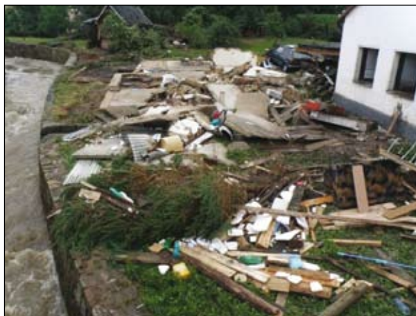
Ulice Boženy Němcové