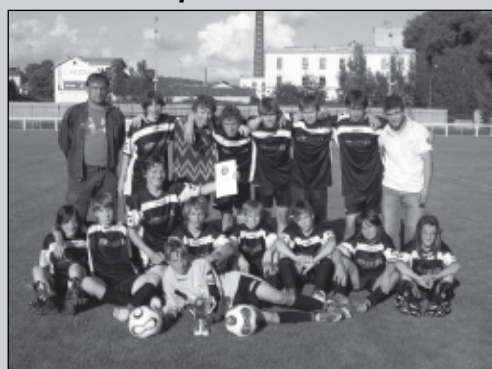
Vítěz okresního přeboru a okresního poháru ČMFS, mužstvo starších žáků