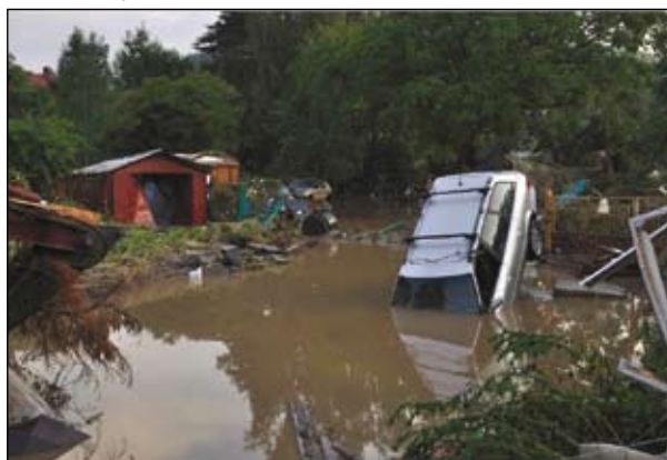
Ulice Pod Ostrým