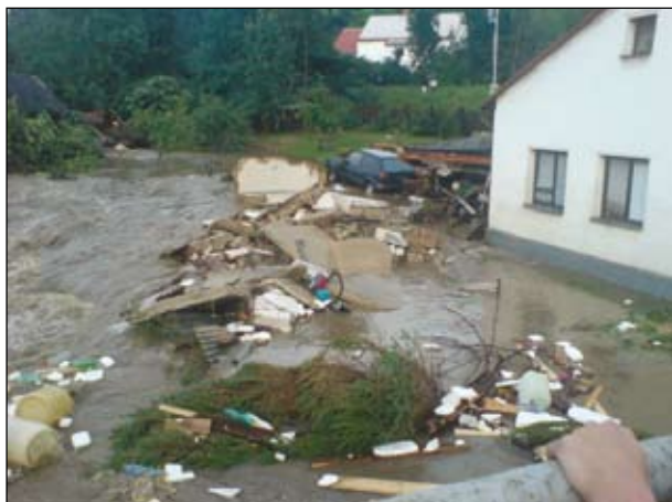
Ulice Boženy Němcové