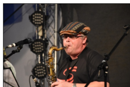
Více fotografií na www.benesovnpl.cz.