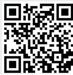
Den s Benarem