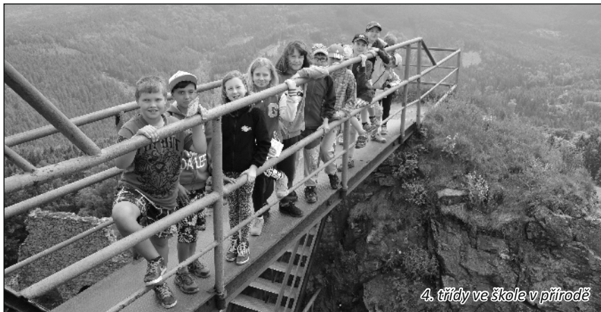
4. třídy ve škole v přírodě

Na začátku června se uskutečnily také dvě poslední školy v přírodě - týden od 6. do 10. 6. v Jiřetíně pod Jedlovou si užili žáci obou 4. tříd, kteří se jako poutníci se vydali s patronem Tolštejnského panství loupežníkem Vildou za pokladem a sbírali do vandrovního mini pasu razítka, za která na konci pobytu získali dekret Tolštejnského panství. Úkoly, které žáci v průběhu školy v přírodě plnili, byly různé: naučili se orientovat podle mapy a buzoly, nabatikovali si tričko, poznávali luční byliny, hledali v textu odpovědi týkající se míst, která navštívili, zpívali písně u táboráku, účastnili se pyžamové party, překonávali překážky v lanovém parku a podobně. Jejich mladší spolužáci - děti z přípravy a žáci 1. A - si svou první školu v přírodě užívali v prodlouženém víkendovém ve Sloupu v Čechách. Jejich pobyt byl motivován cestou za pohádkou, kdy si děti malova-