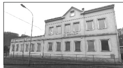
Stav budovy bývalého řeznictví z roku 2014 - Českolipská 282.