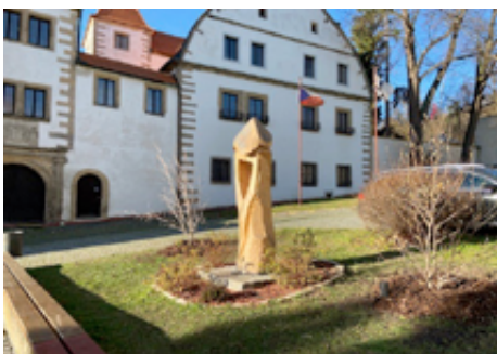
Nově zasazené magnolie na náměstí.