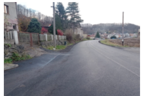
Plánovaná oprava chodníku v ul. Českolipská.

V roce 2022 chceme také zahájit práce na vrtu, který v budoucnu umožní zásobování vodou v lokalitě Ovesná. Pokud bude zjištěna jeho dostatečná vydatnost, mohl by v případě potřeby pomoci se zásobováním vodou i městu Benešov nad Ploučnicí a také zahrádkářské kolonii. Na vybudování vrtu jsme obdrželi dotaci ve výši 60%.