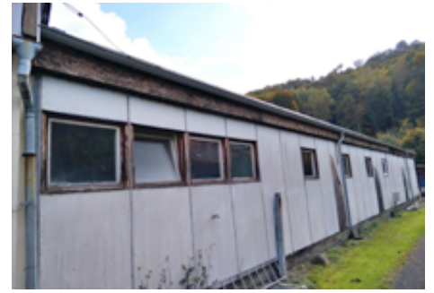
Rekonstrukce objektu u fotbalového hřiště.

Nejen řidiči ale i chodci určitě ocení úpravy komunikace Vilová, na které v letošním roce proběhla rozsáhlá rekonstrukce vodovodu a kanalizace.