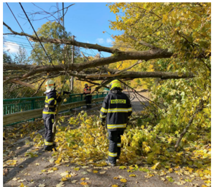
Jednotlivé zásahy.