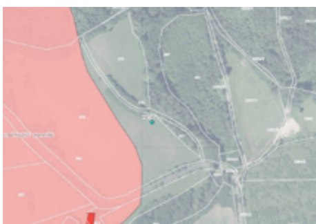
Práce na vrtu v lokalitě Ovesná.

V roce 2022 chceme také zahájit práce na vrtu, který v budoucnu umožní zásobování vodou v lokalitě Ovesná. Pokud bude zjištěna jeho dostatečná vydatnost, mohl by v případě potřeby pomoci se zásobováním vodou i městu Benešov nad Ploučnicí a také zahrádkářské kolonii. Na vybudování vrtu jsme obdrželi dotaci ve výši 60%.