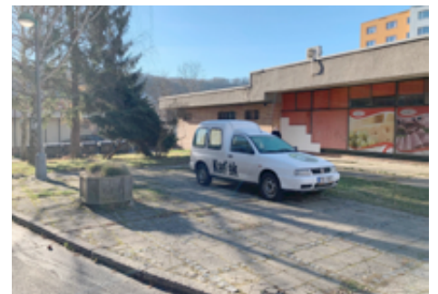
Budoucí nová parkovací místa u samoobsluhy.

Ke zvýšení počtu parkovacích míst pro naše občany i pro návštěvníky města bezesporu také přispěje vybudování nového parkoviště v ul. Nádražní, na které se již zpracovává projektová dokumentace.