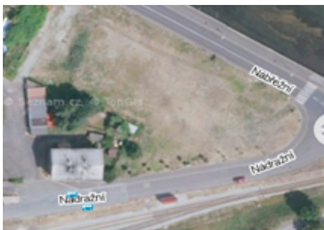
Budoucí nová parkovací místa v ul. Nádražní.

Plánujeme opravu chodníku v ulici Českolipská, kde mají v části nad železničním viaduktem probíhat pokládky internetového vedení a při té příležitosti bychom chtěli vyměnit i stávající dlažbu za novou. Zároveň bychom rádi provedli prodloužení tohoto chodníku až ke křižovatce s ul. Valkeříckou. Záměrem je zvýšit bezpečnost našich občanů v tomto úseku. Na prodloužení chodníku jsme již opakovaně požádali o dotaci SFDI.