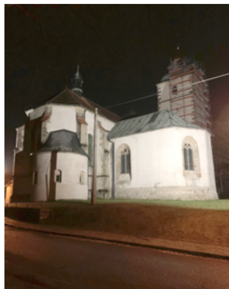
Kostel Narození Panny Marie je jednou z nejkrásnějších památek našeho města a nám se podařilo ho v předvánočním čase navštívit.