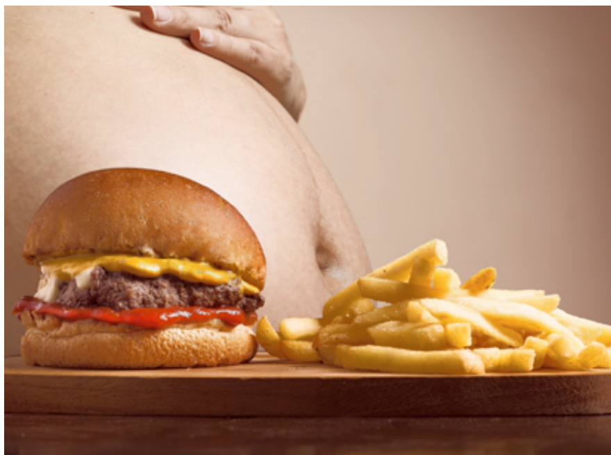
Nezdravé jídlo vede ke špatnému vývoji jedince.

Bohužel smutnou pravdou zůstává, že emočnímu přejídání učíme děti nevědomky od mala. Aby dítě neplakalo, koupíme mu zmrzlinu. Když bude hodné a nebude zlobit, dostane čokoládu. Za statečnost si zaslouží lízátko... Dítě si tak jednoduše spojí, že jídlem a sladkostmi se řeší všechny starosti. A základ emočního přejídání je na světě.