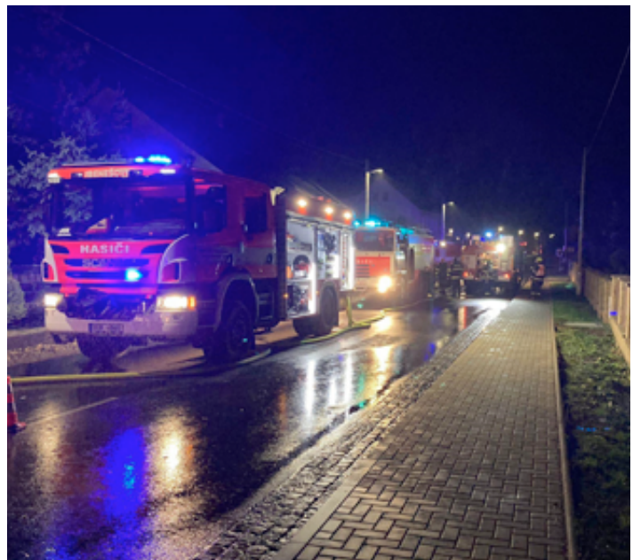
Jednotlivé zásahy.