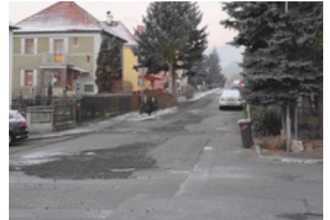
Úpravy komunikace ulice Vilová.

Rádi bychom vybudovali nová parkovací místa u samoobsluhy na sídlišti. Zde nám velmi pomáhají majitelé tohoto objektu.