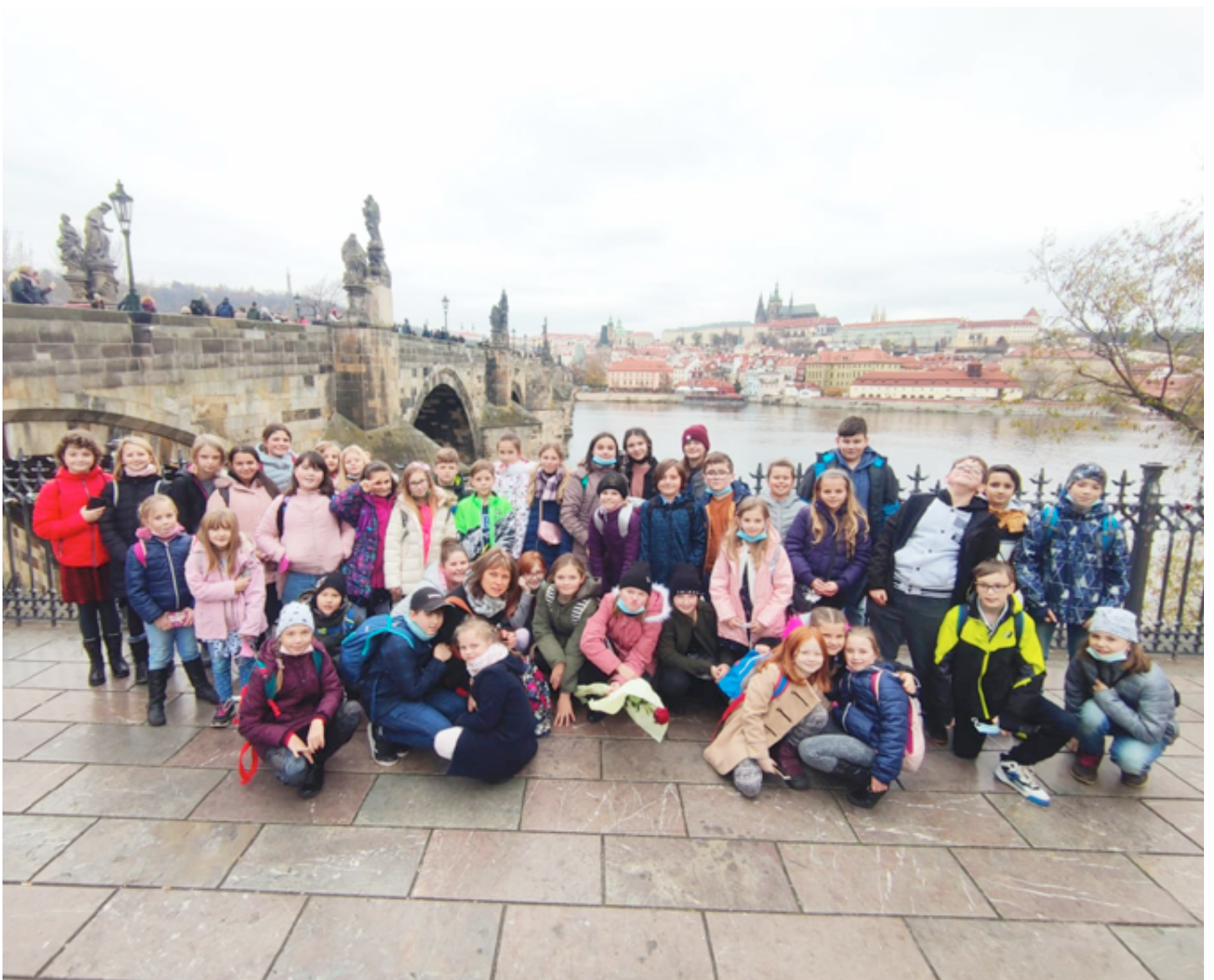
Společné foto účastníků u Karlova mostu.