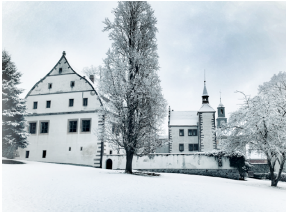
Benešovský zámek v zimním hávu.

Jako velký problém vnímáme parkování v našem městě. Na sídlišti jsme