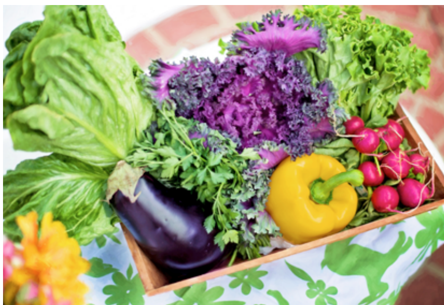
Ke správnému životnímu stylu je potřeba i dostatečný přísun vitamínů.

5. Ukažte dítěti další způsoby, jak se uklidnit. Zkuste třeba procházku, krátkou meditaci, nebo si o problémech promluvte.