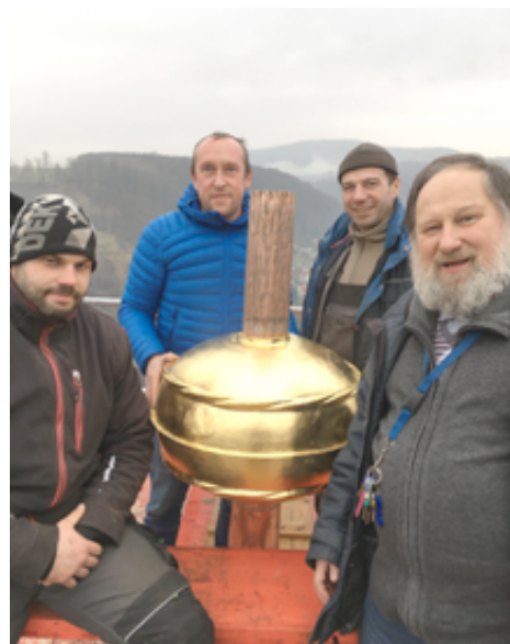
Věž benešovského kostela Narození Panny Marie zdobí zrestaurovaná báhň s křížem.