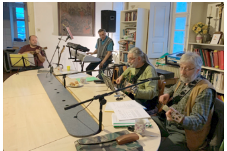
Charitativní akce „Den pro Afriku“.