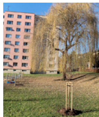
Nová výsadba na sídlišti, kde byly použity lípy v kombinaci s habrem.