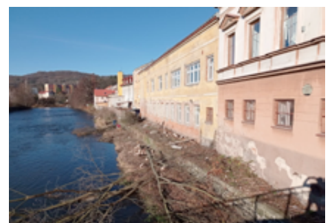
Dokončení rekonstrukce v ul. Nerudova.

Jednou z dalších priorit je také zdárné dokončení rekonstrukce objektu bývalého učiliště v Nerudově ul., které bude sloužit nejen našim dětem, ale také rodičům, studentům a seniorům.