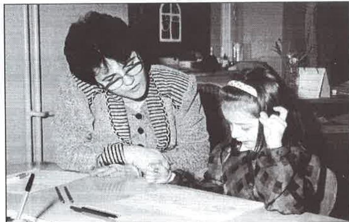
Zápis do první třídy.