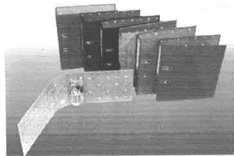
Pákové mechanismy do šanonů jsou jedním ze základních výrobních programů Benešovské firmy Interkov.