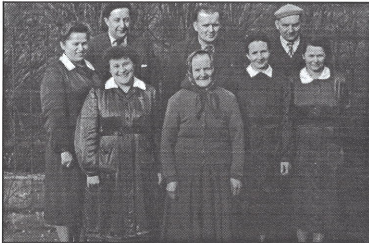
Zaměstnanci kina (koncem padesátých let)

Návštěvnost kina byla vzhledem k dnešku nesrovnatelná. Např. v roce 1958 počilo kino svou přítomností více jak 135.000 lidí na celkem 660 představení. To je průměrná návštěvnost 205 diváků na jedno představení! Zahrneme-li i okolní obce, pak každý občan včetně nemluvnat navštívil ročně 30krát filmové představení. Příjmy kina byly v tomto roce Kčs 400.000,- a převýšily výdaje více jak o Kčs 50.000,-. V té době bylo v kině zaměstnáno 7 pracovníků, z toho 2 ve vedlejším pracovním poměru.