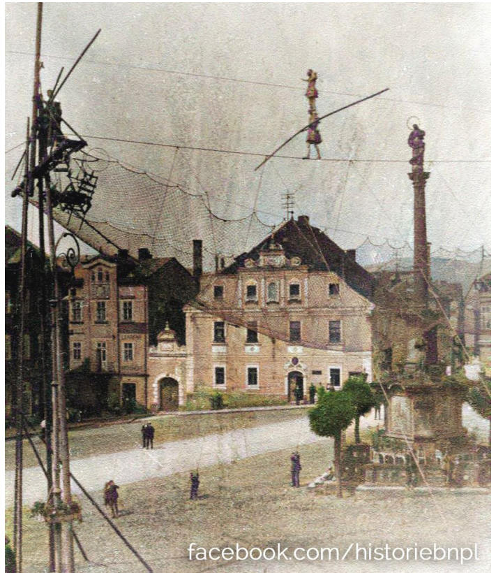
Tanečníci na provazech rodinného klanu Blondin z Plzně.

V červnu 1930 vystupovala na benešovském náměstí skupina plzeňských provazochodců (též tanečníku na provazech) z rodiny Blondin. Došlo tehdy k neštěstí, kdy jeden z vystupujících udělal chybu a z lana spadnul. Byl tehdy hospitalizován z velmi těžkými zraněními.