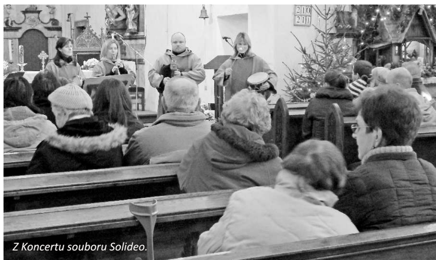
Z koncertu souboru Solideo.