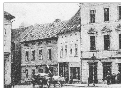
Obuvnictví Puhl v čp. 94 (dům zcela vlevo)

řeznictví „U Jelena“ a nakládané červené zelí.