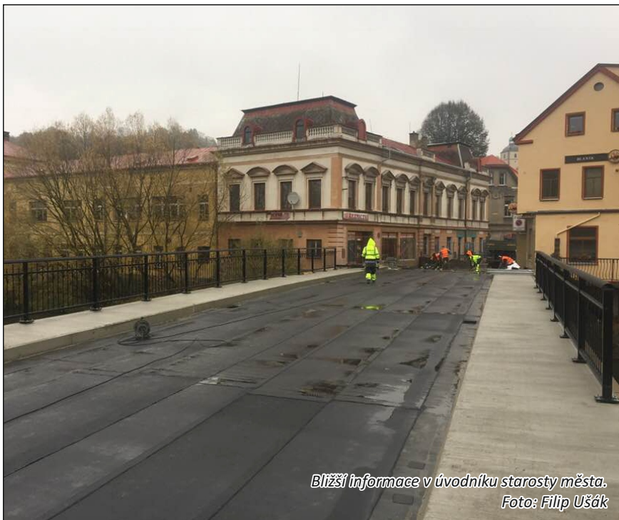
Bližší informace v úvodníku starosty města.