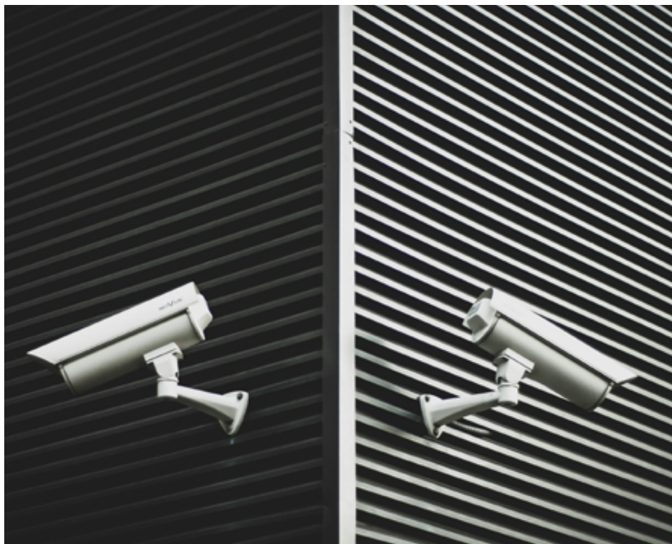
Kamerový systém - ilustrační foto.