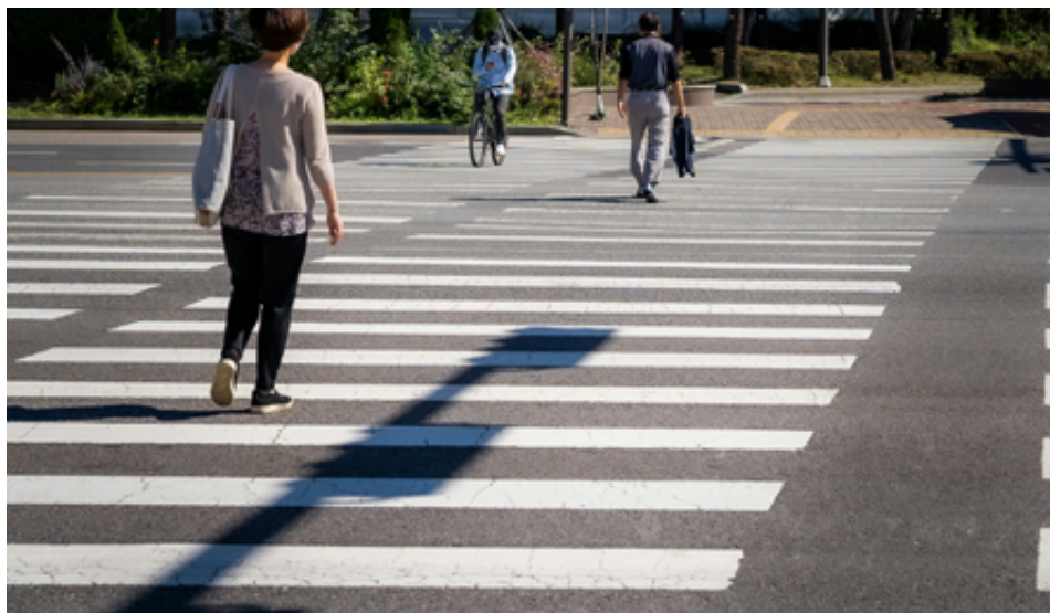
Přechod pro chodce - ilustrační foto.

Připravujeme celkovou rekonstrukci vzduchotechniky ve školní jídelně.