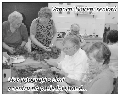
Vánoční tvoření seniorů