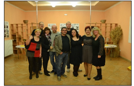
Z akcí Rodinného centra Medvídek a Centra dětí a mládeže...