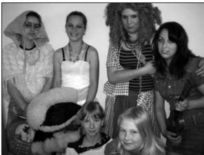
Klubko si pro naše nejmenší připravilo na Den dětí moc hezký program.