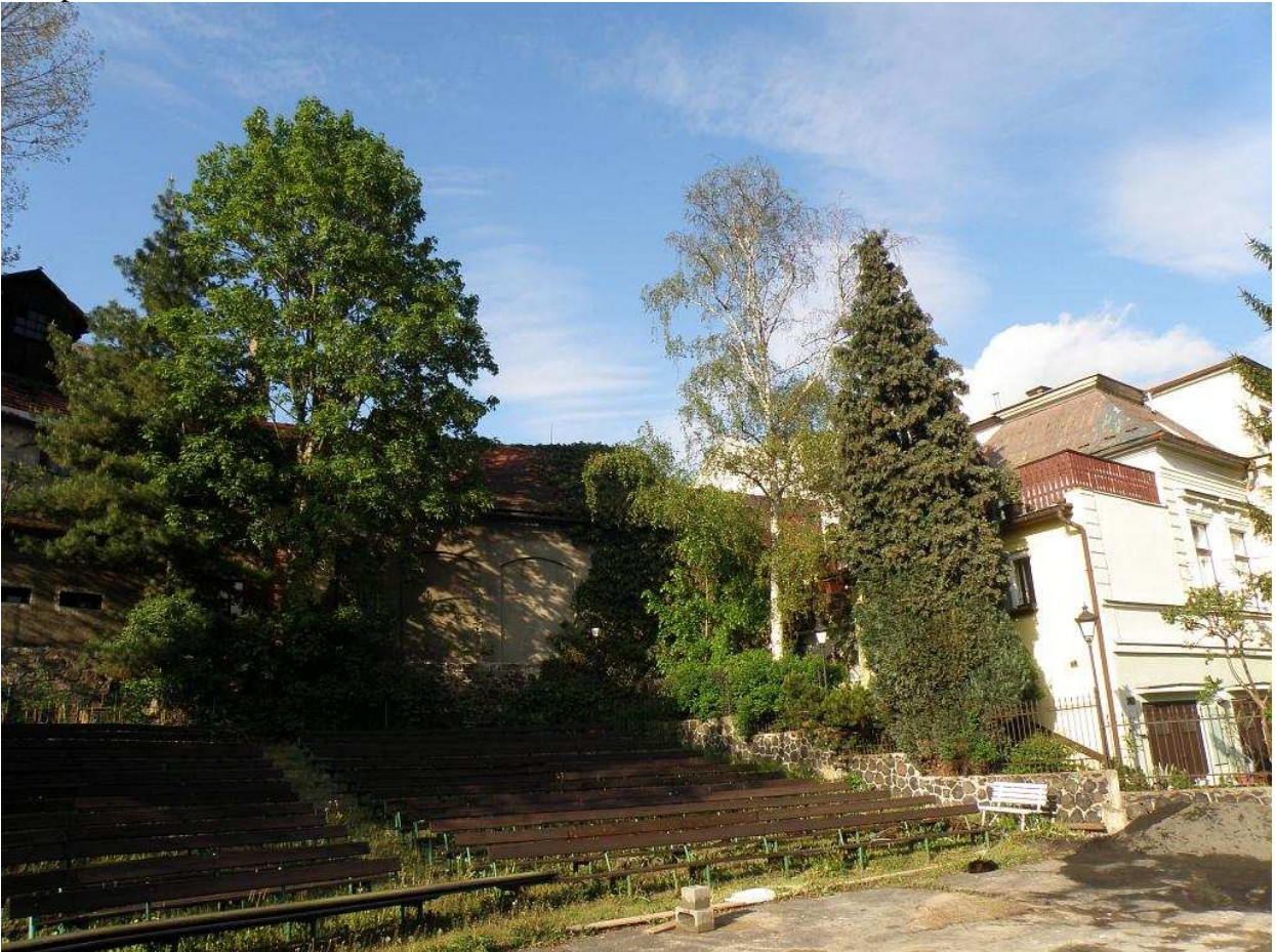
Fotopříloha č. 1 – letní kino