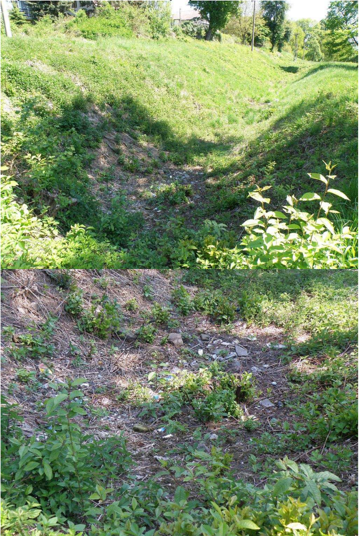
Fotopříloha č. 3 – černá skládka v zámeckém příkopu