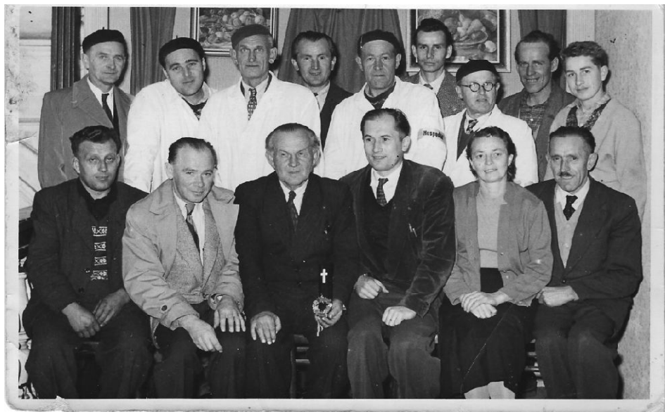
foto z konce 50. let