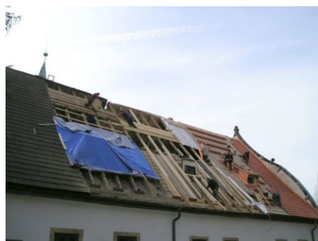
Všimli jste si, že se zámecká střecha převlékla do oranžova?