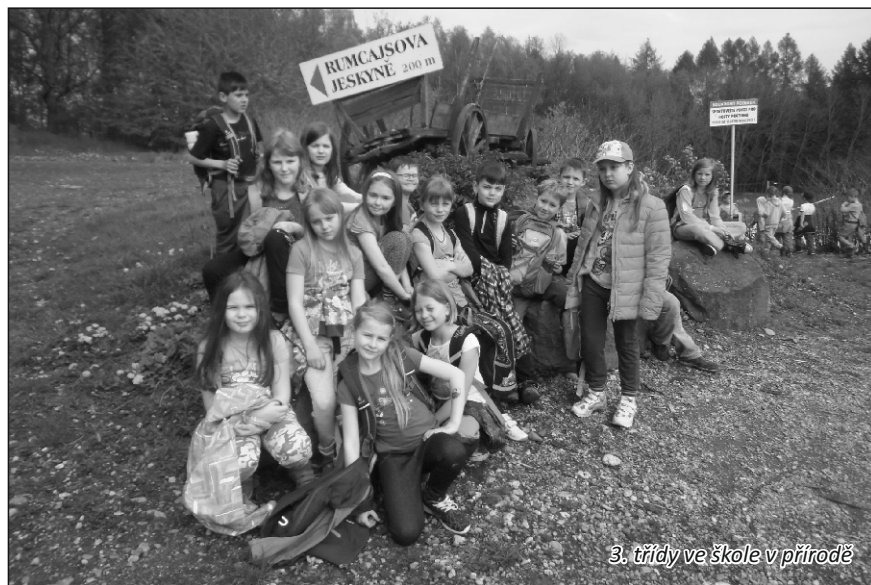
3. třídy ve škole v přírodě

Konec dubna a začátek května patřil výjezdům našich žáků do škol v přírodě. Nejprve vyrazili za dobrodružstvím žáci 5. a 6. tříd, kteří si školu v přírodě užili v Rekreačním středisku Máj v Plasích u Plzně. Kromě netradičního učení se zapojili do zábavného programu „Tutanchamonova kletba aneb Mumie se zlobí“, při které se mohli lépe poznat nebo se naučit společně táhnout za jeden provaz, aby společně dosáhli nějakého cíle. Žáci obou třetích tříd strávili pět dní ve škole v přírodě v areálu Prostřední Mlýn v Českém ráji. Všichni se zapojili do celopobytové hry z říše animáčů a pohádek, poznávali okolí, sportovali a bavili se při společných aktivitách. Na zatím poslední výjezd vyrazily děti druhých tříd za loupežníky do Tolštejského panství v Chatě Vilda v Jiřetíně pod Jedlovou. Pro většinu z nich to bylo úplně první odloučení od rodičů na delší dobu, a protože náročný program s občasnou slzičkou zvládli úplně všichni účastníci, byli na závěr zaslouženě odměněni medailí a dekretem Tolštejského panství. Všichni žáci si své školy v přírodě užili a přijeli obohaceni o nové zážitky a zkušenosti a jejich pobyty přispěly ke vzájemnému stmelování třídních kolektivů. Všem pedagogům a vychovatelům, kteří pro žáky školy v přírodě připravili a s dětmi je absolvovali, patří velké poděkování.