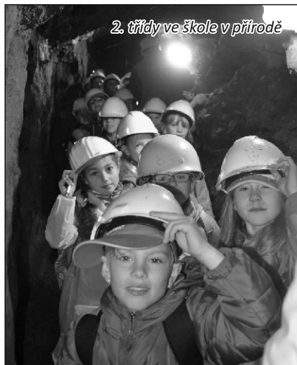
2. třídy ve škole v přírodě