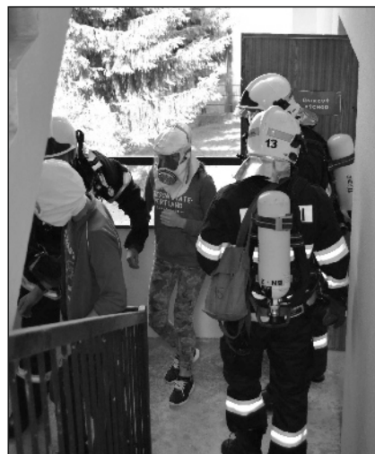
Cvičný zásah na benešovské základce - požár střechy.