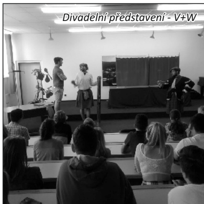
Divadelní představení - V+W