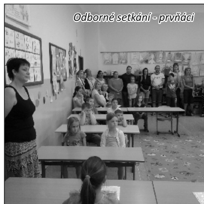
Odborné setkání - prvňáci