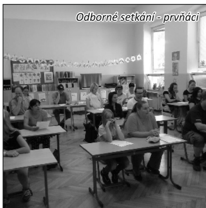
Odborné setkání - prvňáci