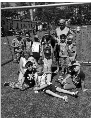
MSK Benešov nad Ploučnicí

1. - v červnu jsme uspořádali okresní turnaj mladších přípravek – naše družstvo v něm zvítězilo.