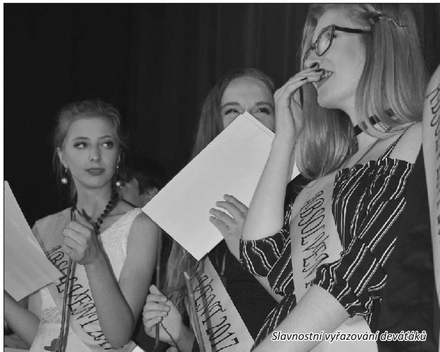
Slavnostní vyřazování devětáček

Než začal poslední měsíc školního roku, vyjelo 42 žáků osmých a devátých tříd na výchovně vzdělávací exkurzi do polské Osvětimi. V úterý 30. května ve spolupráci s cestovní kanceláří CK2 navštívili polské město Osvětim (něm. Auschwitz). Zde si žáci prošli společně s průvodci koncentrační tábory v Osvětimi a Březince. Měli možnost si vyslechnout velmi zajímavý odborný výklad a současně shlédnout na vlastní oči hrůzy nacistické propagandy. Celý výlet byl velmi silným emočním zážitkem pro všechny.