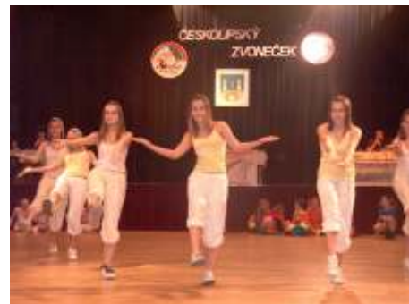
Snímek se vracíme k běžné soutěži eskolipský zvoneček.