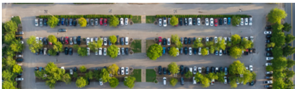
Parkování na sídlišti - ilustrační foto.

Probíhá zpracování projektu na rozšíření parkování na sídlišti a zajišťování podkladů pro vydání stavebního povolení.