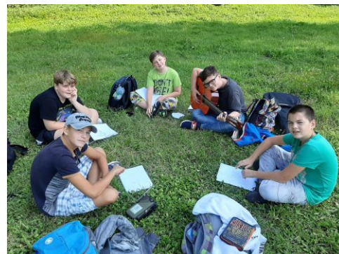
V průběhu září probíhala výuka v některých třídách také mimo vlastní učebny.