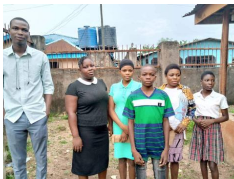
Destiny s dalšími dětmi

fotky a informace o dětech z Afriky které podporujeme a kam směřuje