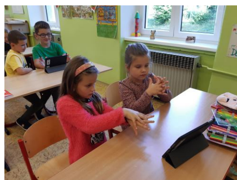
Třída 2.B a jak si správně čistit ruce.