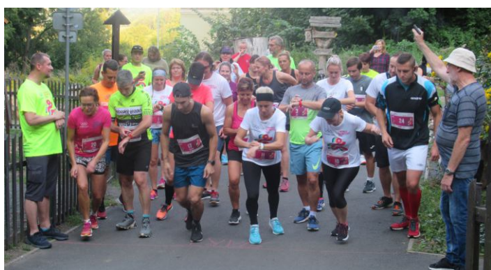
Start Olympijského běhu.

Kompletní seznam výsledků najdete na internetových stránkách benesovnpl.cz .