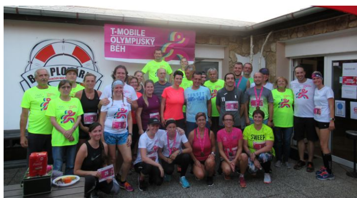
Všichni účastníci Olympijského běhu T-Mobile 2020.