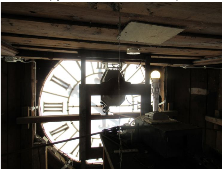
Ve věži za ciferníkem