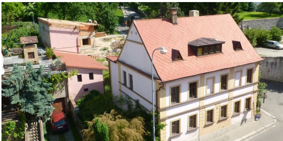
Dům čp. 40, foto: Luděk Smejkal

Vladimír Šefl, 2020 facebook.com/historiebnp1