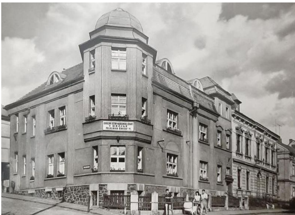
Blok domů čp. 352, 461 a 462 (zdravotní středisko) byl postupně vystavěn stavitelem Hegenbarthem.