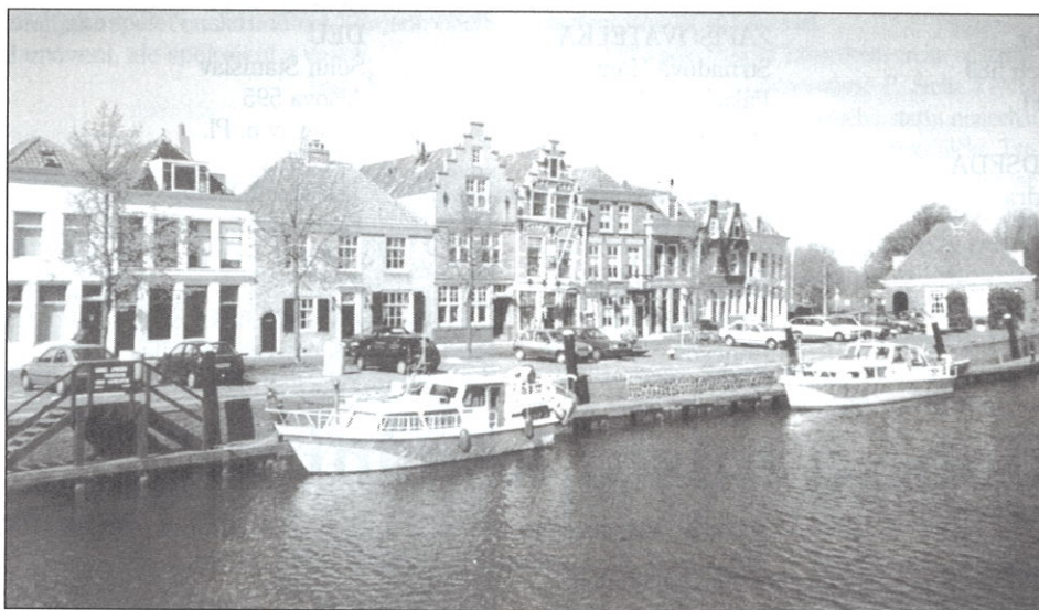
Padací most na jednom z četných kanálů.

V 18. století bylo dobyt Napoleonem a stalo se vazalským státem. V 19. století se osamostatnilo (bez Belgie) a stalo se konstituční monarchií, kterou je dodnes.