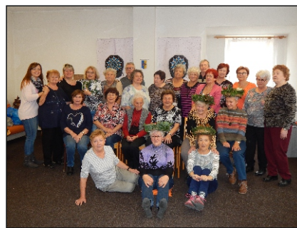
Vánoční tvoření v Klubu seniorů (akce podpořena projektem Euroregionu Labe/Elbe „Rozvíjíme tradiční spolupráci“).