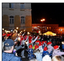
Rozsvícení vánočního stromku zachytil na krásných fotografiích pan Jan Scháněl.