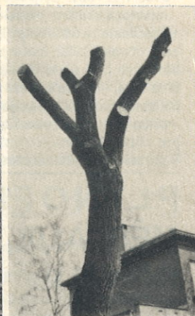
Operace se zdařila, pacient zemřel