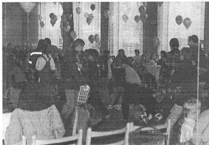
Snímek ze zábavného odpoledne pro děti dne 7.11.1998.