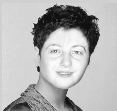
Účesy navržené PC