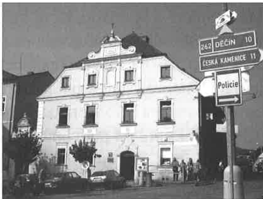
dům č.p. 17