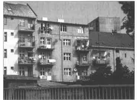
dům č.p. 494