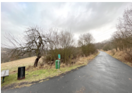
Cyklostezka do Františkova.