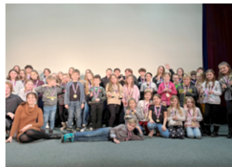
Oscarové odpoledne CDM.