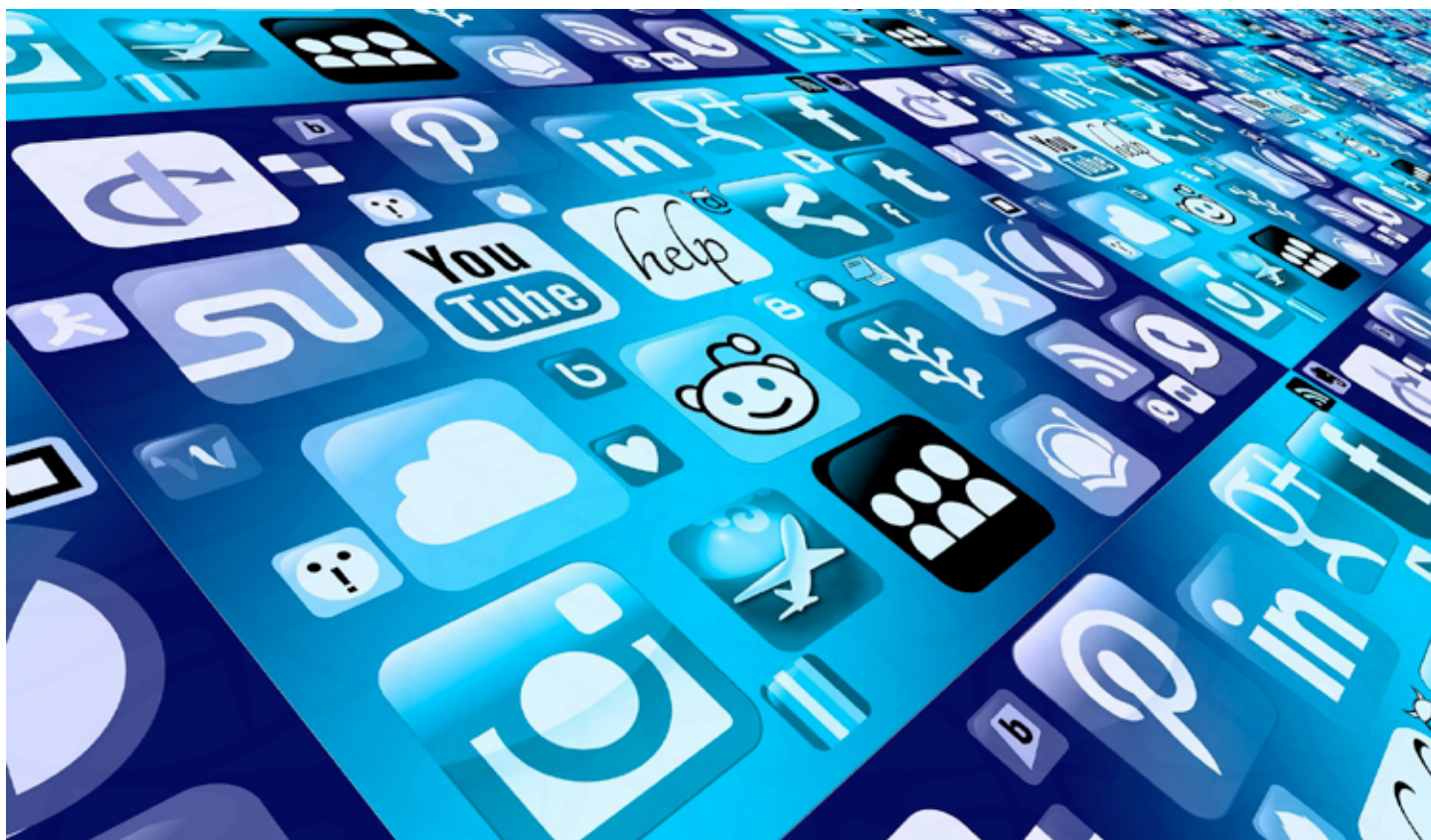
FOMO: strach z promeškání může mít svou podobu i v sociálních sítích.

Pro život ve 21. století je typické propojení celého světa a obrovské množství informací. Snažíme-li se všechny tyto informace neustále vyhledávat a přijímat, snadno se můžeme dostat do pastí, protože zatímco se budeme hořčně snažit držet krok s děním na vzdálených místech, ztrácíme postupně přehled o dění v našem nejbližším okolí. A časem pak můžeme s hrůzou zjistit, že nám nakonec uteklo to nejdůležitější: náš život, naše tady a teď.