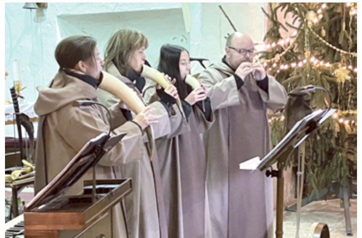
Koncert souboru SOLIDEO v benešovském kostele.