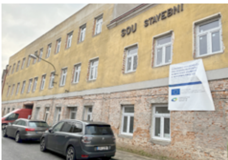
Středisko volného času.