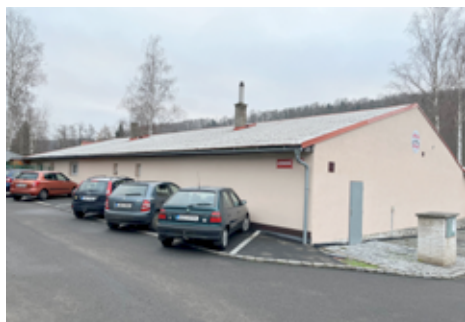
Budoucí oprava střechy objektu na koupališti.