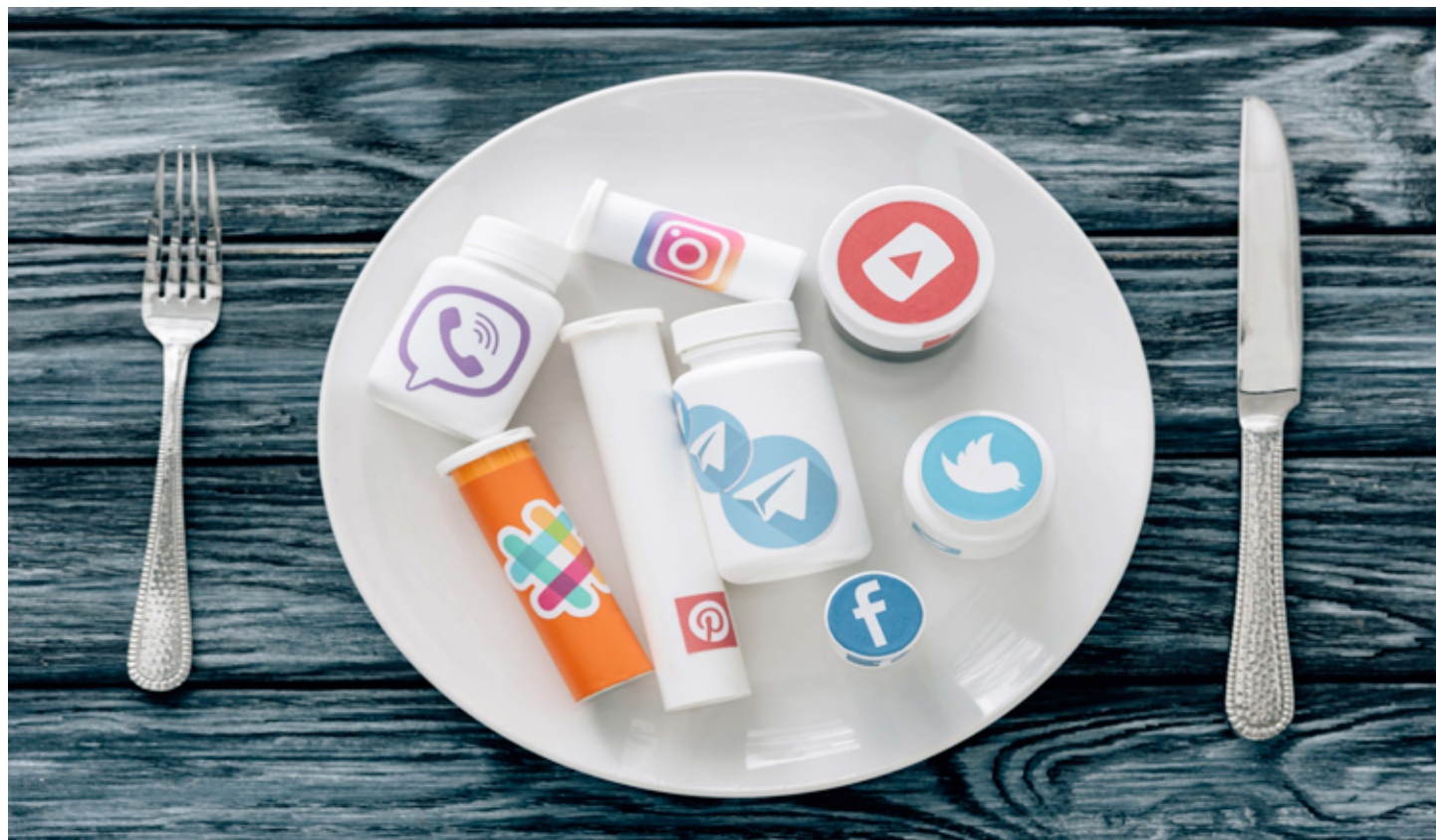
FOMO: strach z promeškání může mít svou podobu i v sociálních sítích.

Má-li člověk tendenci neustále sledovat životy druhých (a zvláště pak jejich životy na sociálních sítích), může