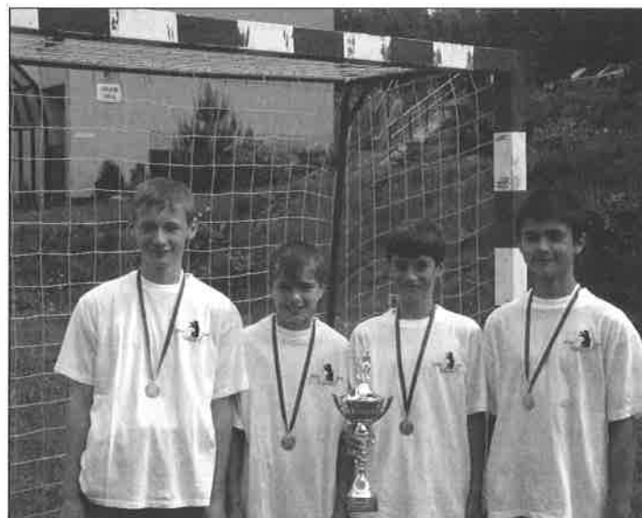
Foto: Vítězné družstvo s pohárem Vladimíra Šmicera