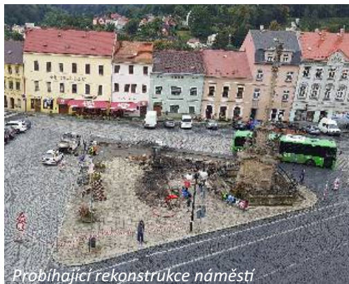
Probíhající rekonstrukce náměstí

Rovněž se již začalo pracovat na rozpočtu města na příští rok a s tím i na projektové přípravě akcí, které jsou v plánu realizovat v příštím roce i následujících letech. Jedním z největších a nejnutnějších projektů bude například oprava střechy na bílé škole, která je ve velice špatném stavu a investice to bude v řádech milionů korun.