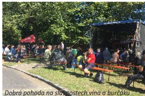
Dobrá pohoda na slavnostech vína a burčáku