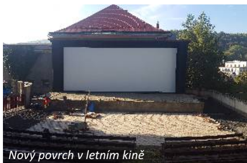
Nový povrch v letním kině

Ze současně probíhajících akcí je to stále úprava náměstí pro otáčení autobusů. Zde bylo nutné udělat nezbytnou technologickou přestávku pro vytvrzení betonového podkladu. Práce již opět pokračují a dokončení dodavatel stavby odhaduje do konce měsíce října.