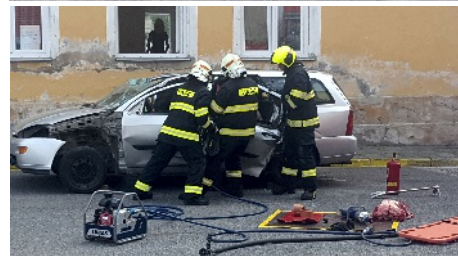
Foto ze slavnostního otevření hasičské zbrojnice. Naším hasičům přejeme, aby se jim v nových prostorách líbilo, klidně služby a šťastné návraty ze zásahů.