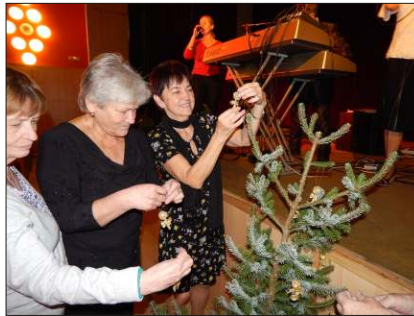
Vánoční setkání seniorů v kině.