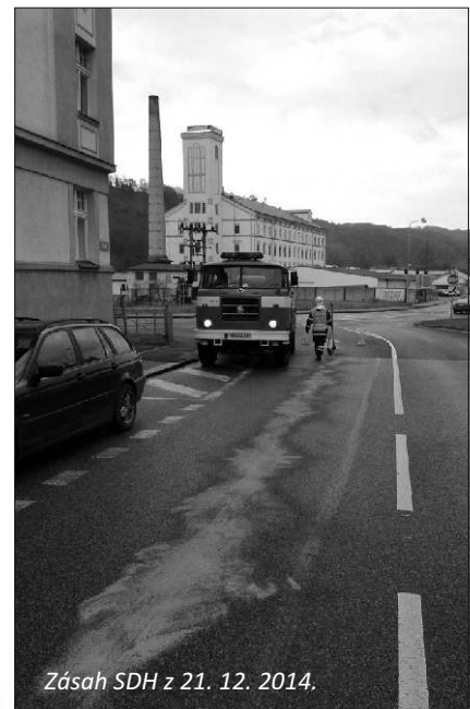
Zásah SDH z 21. 12. 2014.