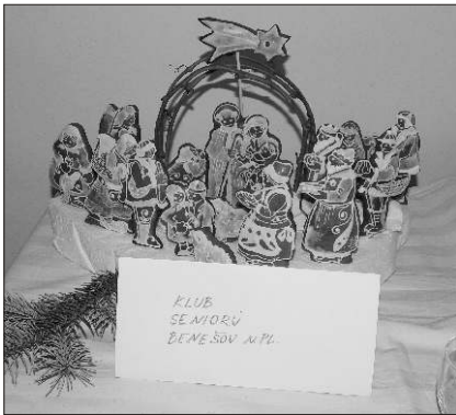
Betlém z perníku (Klub seniorů).