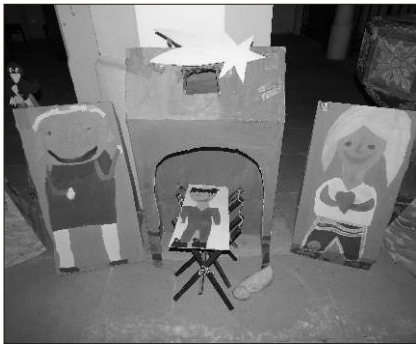
Betlém speciální třídy pod vedením Mgr. Hubáčkové.

Kdo jste výstavu betlémů promeškal, nesmutněte. Jsou k vidění v kostele ještě do 12. 1. 2015. A pro ty, kteří to nestihnou ani v tomto termínu, níže malá fotoukázka: