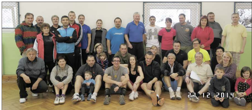
Vánoční volejbalový turnaj.