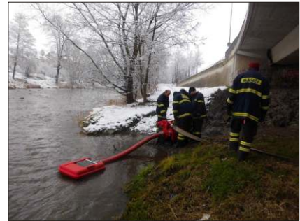
Cvičení hasičské jednotky.