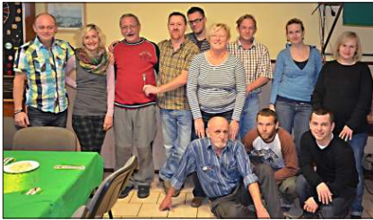
Soutěž o NEJ bramborový salát.