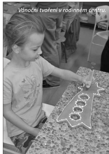
Vánoční tvoření v rodinném centru.