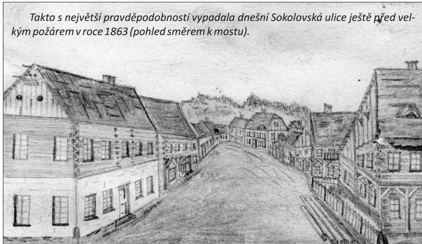
Takto s největší pravděpodobností vypadala dnešní Sokolovská ulice ještě před velkým požárem v roce 1863 (pohled směrem k mostu).