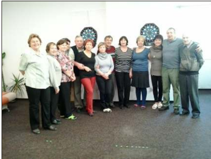
Vánoční turnaj seniorů v šipkách.