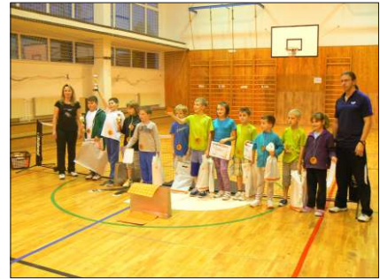
Tenisový turnaj dětí.