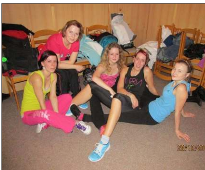
Vánoční Zumba maraton.