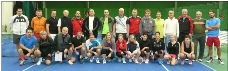
Tenisový turnaj dospěláků v Děčíně.