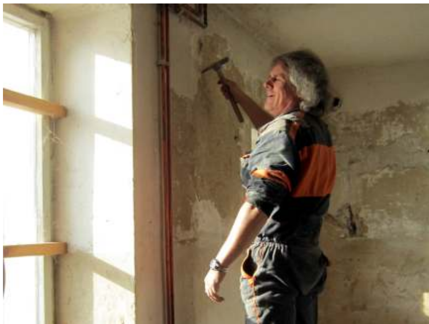
V budoucím klubu důchodců, který vzniká v budově "A" bývalého učiliště, se usilovně pracuje. O rekonstrukci prostor se starají pracovníci Služeb města.