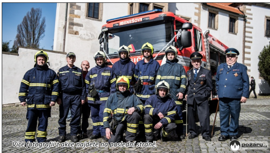
Více fotografií z akce najdete na poslední straně.

Město Benešov nad Ploučnicí pořídilo pro svoji jednotku sboru dobrovolných hasičů novou cisternovou automobilovou stříkačku na podvozku Scania. S jejím financováním (celková cena 5.912.665,- korun) pomohla městu státní dotace Ministerstva vnitra z Fondu zábrany škod (2,5 milionu korun). Zbytek (3.412.665,- korun) uhradí město ze svého rozpočtu. Na zaplacení vybavení vozidla se podílely také obce, které spadají do hasebního obvodu města Benešov n/Pl., Malá Veleň, Františkov n/Pl., Dobrná. Vozidlo CAS 20 4000/240 S2R hasičům dodala na základě vítězství ve výběrovém řízení společnost WISS CZECH. Scania nahradila vozidlo CAS25 Š706, které bylo vyrobeno v roce 1978 a u jednotky sloužilo celých 38 let.