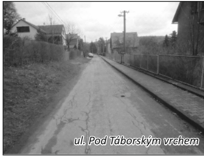
ul. Pod Táborským vrchem