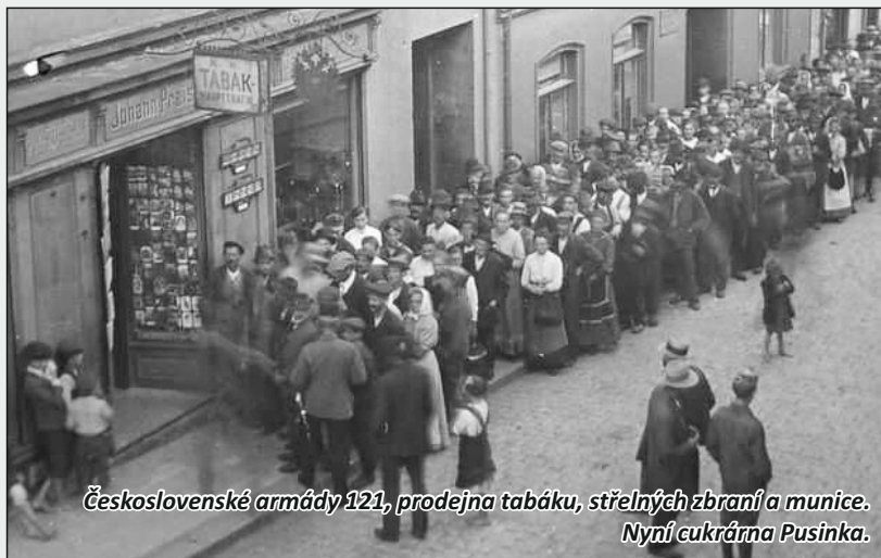
Československé armády 121, prodejna tabáku, střelných zbraní a munice. Nyní cukrárna Pusinka.

20. ledna roku 1911 si jeden benešovský kočí koupil balíček tabáku a vzal si ho s sebou do hostince „U zlatého lva“ na Děčínské ulici (nyní „Holubárna“). Po usednutí si ke stolu štamgastů, začal jen tak mezi řečí plnit hlavu fajfky pořízeným tabákem. Poté začal pohodlně pokařovat. Když tu najednou, i přes jištění dýmky, vylétlo cosi kulovitěho z fajfky až do stropu. Hustý dým zcela kočího zcela zakryl a jeho obličej úplně zčernal. Všichni hosté z hospody utekli, někteří dokonce vyskákali z oken. Hostinský utekl do jídelny, kde se zhroutil, protože si myslel, že se někdo zastřelil. Šetření poté ukázalo, že v zakoupeném tabáku byla 7 milimetrová patrona, která díky vysoké teplotě rozehnuté fajfky explodovala.