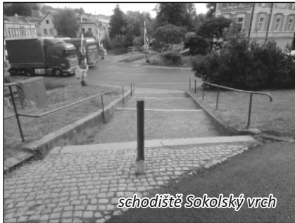
schodiště Sokolský vrch