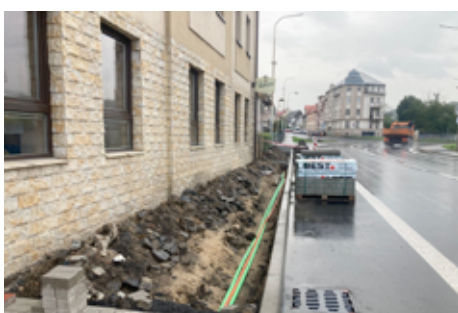
Oprava chodníků na Děčínské ulici.