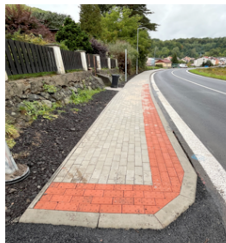
Oprava chodníku v Českolipské ulici.

Dokončujeme rekonstrukci toalet u obřadní síně.