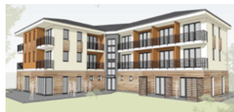
Budoucí Komunitní centrum pro seniory.

Během podzimu proběhne plánovaná rozšířená oprava bazénové vany na koupališti.