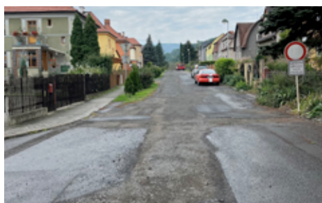
Budoucí oprava Vilové ulice - zhotovitel vybrán.