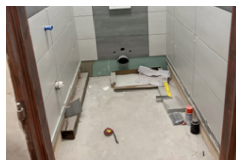
V obřadní síni probíhá rekonstrukce toalet.