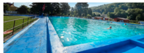
Bazénová vana se dočká opravy.