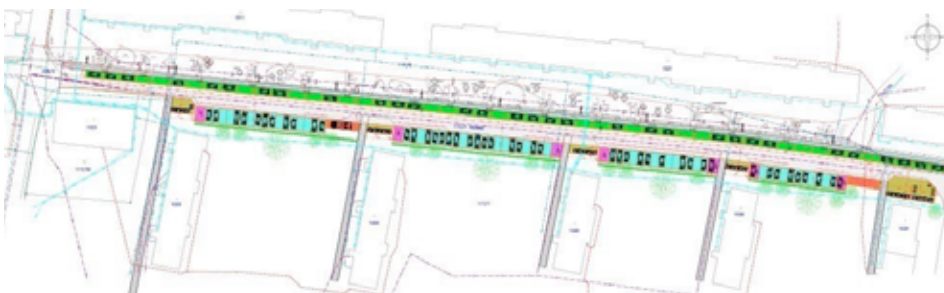
Hotová studie nového parkování na sídlišti.