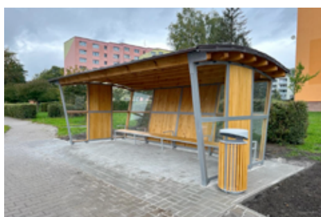
Nová, krásná zastávka na Sídlišti.