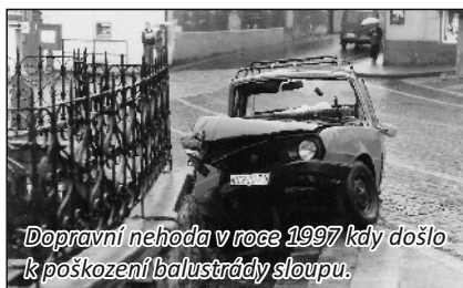
Dopravní nehoda v roce 1997 kdy došlo k poškození balustrády sloupu.

Snímek z roku 1948 zachycující Mariánský sloup v poválečném stavu s bezhlavou sochou Immaculaty. Na spodní části sloupu je patrné poškození od projektilů střelných zbraní. Prvním poválečným zásahem bylo odstranění čtyř stromů rostoucích v jeho blízkosti. Začátkem padesátých let byla opravena i vlastní socha.