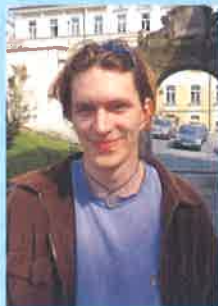
L. Balán "Jistě, alespoň by se dalo vybrat na co se chci dívat."