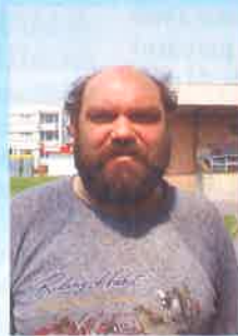
P. Peč "Jsem zcela pro kabelovku, stojí to za to."