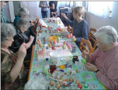
Velikonoční tvoření v klubu seniorů.