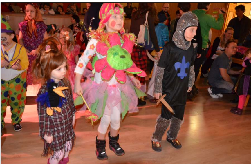
Bonbonový karneval Rodinného centra Medvídek.