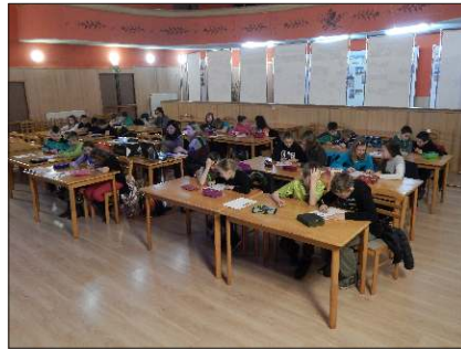
Podstávkový testík pro žáky ZŠ.