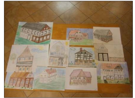
Podstávky očima dětí.