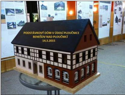
Z výstavy o podstávkových domech.