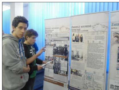
Z výstavy Zmizelí sousedé.