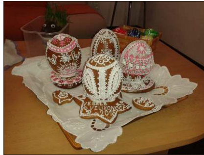
Soutěžní exponáty Benešovské kraslice.