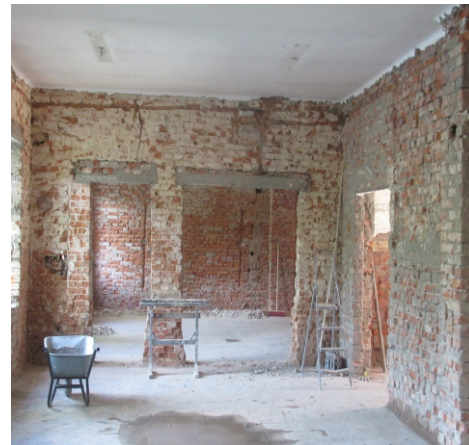
Prostor bývalé jídelny (11. května 2021)