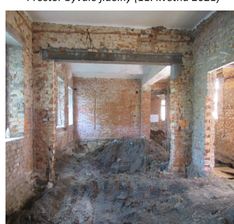
Prostor bývalé jídelny (1. června 2021)