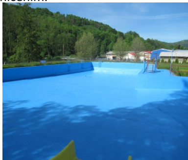
čerstvě natřený bazén

Pracovníci Služeb města BnPl. začátkem prvního letního měsíce nově natřeli vanu bazénu na našem koupališti. Nový nátěr zajistí snadnější údržbu bazénu a zároveň ochranu před poničením.