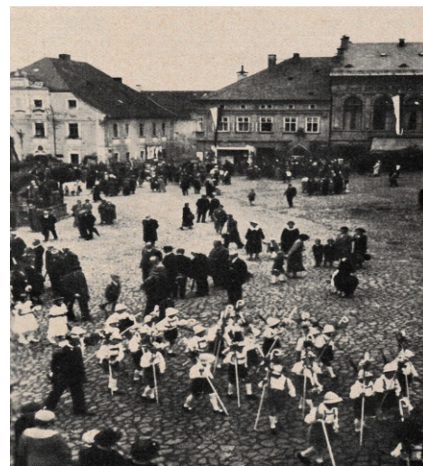
Slavnost Těla a Krve Páně 1936

Vladimír Šefl, facebook.com/historiebnp1