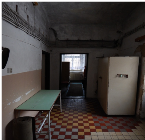
Prostor vedle bývalé kuchyně (16. února 2021)