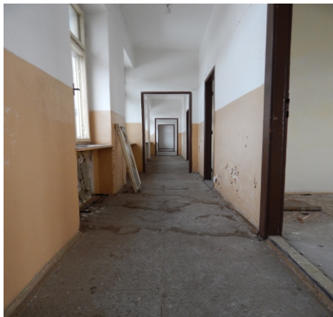
Chodba ve druhém patře (16. února 2021)

podívat na dosavadní etapy prací na tomto projektu. Na tento projekt s oficiálním názvem „Středisko volného času pro rozvoj klíčových kompetencí zájmového a neformálního vzdělávání“ byla získána dotace od Ministerstva pro místní rozvoj ve výši 18 000 000 Kč.