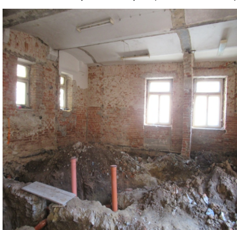
Prostor vedle bývalé kuchyně (1. června 2021)