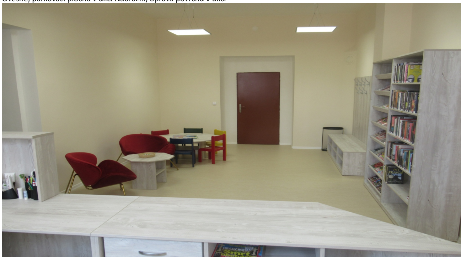
Nově zrekonstruovaná recepce knihovny