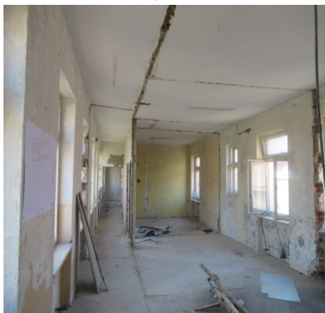
Chodba ve druhém patře (27. dubna 2021)