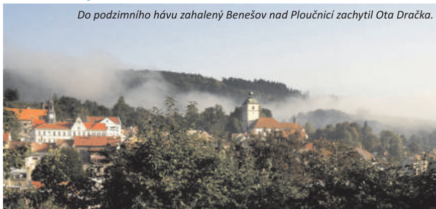
Do podzimního hávu zahalený Benešov nad Ploučnicí zachytil Ota Dračka.

Prioritami příštího roku bude dofinancování opravy mostu na Sokolský vrch, v případě přidělení dotace pak zateplení a výměna oken na nové škole, další etapa vý-