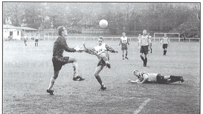
Text a foto Karel Nikodym

Například s SKP Ústí nad Labem dne 4. 10. 97 jsme začali hezky. Vedli jsme už v páté minutě střelcem Rudolfem, ve 25 minutě hosté vyrovnali - poločas 1 : 1. Ve druhém poločase asi v 15 minutě jsme opět vedli střelcem Linhartem 2 : 1. Střelceky lepší byli domácí. Jak se říká „nedáš dostaneš“ platilo pro domácí. Hosté opět vyrovnali na 2 : 2. Rozhodnuto bylo v 70 minutě. Prohráli jsme 2 : 3. Na snímku je vidět ještě jeden pokus o vyrovnání střelcem Linhartem.