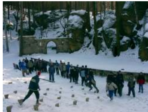
Běh v Lesním divadle

Poprvé jsme letos vyzkoušeli uspořádat soustředění pro fotbalisty od 10-ti do 18-ti let také v zimě. Jistě víte, že v letních měsících je to už tradice osmiletá, ale zima je něco jiného. Pro toto soustředění jsme vybrali bývalé rekreační středisko Benaru ve Sloupu v Čechách v termínu od 22. do 26. února. Již v září zde byla starší příprava a velmi si to chválili, tak jsme tam vyrazili také. Prvotní strach z toho, že bude v chatkách zima, vřdyť byly zrovna více než desetistupňové noční mrazy, se hned po první noci rozplynul, protože akumulace fungovaly velmi dobře. Celého soustředění se zúčastnila tři mužstva – dorostenci, starší a mladší žáci, celkem 34 dětí plus 6 trenérů. Jednotlivá mužstva využívala jak krásných zasněžených terénů v okolí Sloupu, tak i pronajaté školní tělocvičny v Novém Boru. Myslíme si, že se soustředění vydařilo po všech stránkách a zmluvili jsme si termín již také příští zimu. Samozřejmě plánujeme už také letní soustředění a letos vyrazíme od 22. do 29. července do bývalého rekreačního střediska Kaučuku Kralupy „Valdek“ u Rumburku.