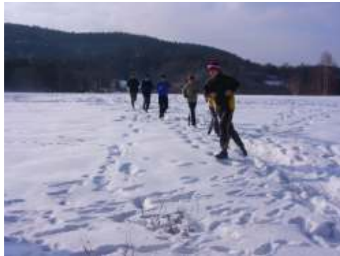
Dopolední výběh v přírodě

Momentky z tréninkových jednotek na soustředění: