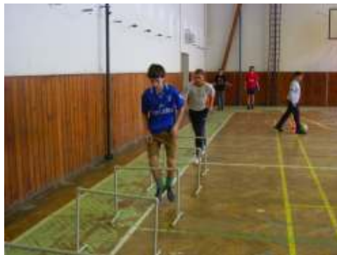
Silový trénink v tělocvičně