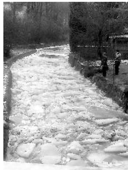
Ledové kry na Bystré

Dne 19. a 20. 2. 2012 ve 12:51 vyjela naše jednotka s technikou Cas 25 v počtu 1+3, DA T4 v počtu 1+2 a DA12-L1R v počtu 1+2, k zanesení česlic a turbíny uvolněným ledem u bývalého závodu Benar ul. Českolipská (Bedřichov). Po příjezdu na místo události jednotka provedla průzkum a následně byla informována o situaci a zvednutí česlic ve Františkově nad Ploučnicí a zmírnění přísunu ledu. Poté byla vyslána vozidla k průzkumu toků v lokalitě Benešova a případnému zamezení dalších problémů s uvolněným ledem. Jednotka se následně přesunula do objektu bývalého závodu Benar 01, kde prováděla uvolnění zaneseného ledu v součinnosti s místními složkami za pomoci těžké techniky, lezecké výstroje a motorových pil. Naplavený led odstraňovala až do setmění a pokračovala v tom i následující den, přičemž držela pohotovost kvůli stále hrozícímu nebezpečí v podobě uvolněného ledu a následnému zanesení řečiště a možnému zatopení blízkého okolí řekou Ploučnicí.