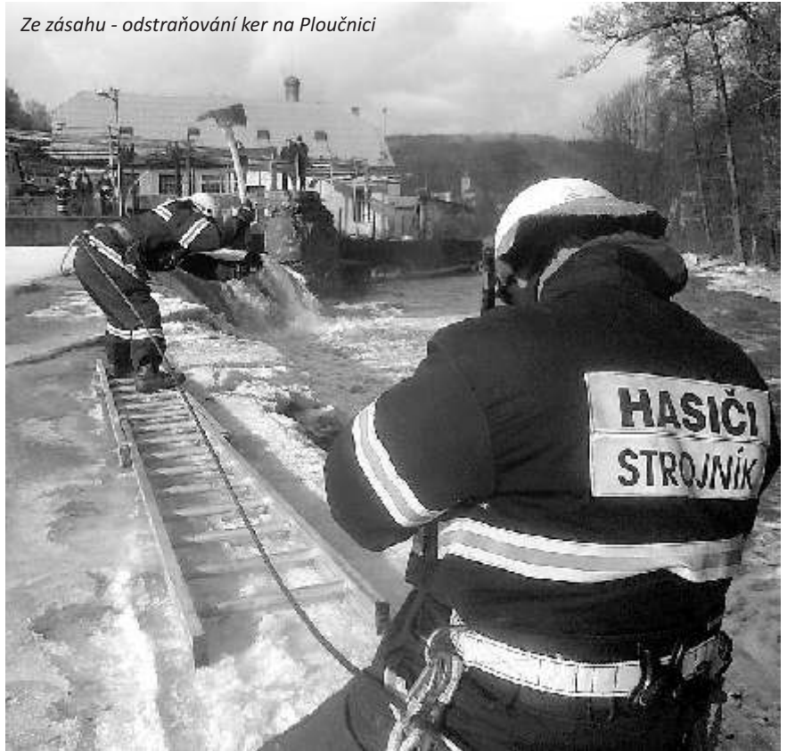
Ze zásahu - odstraňování ker na Ploučnici