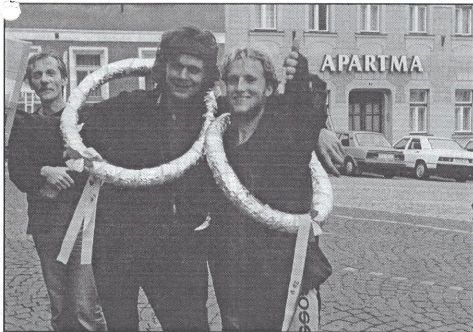
Šťastný návrat domů