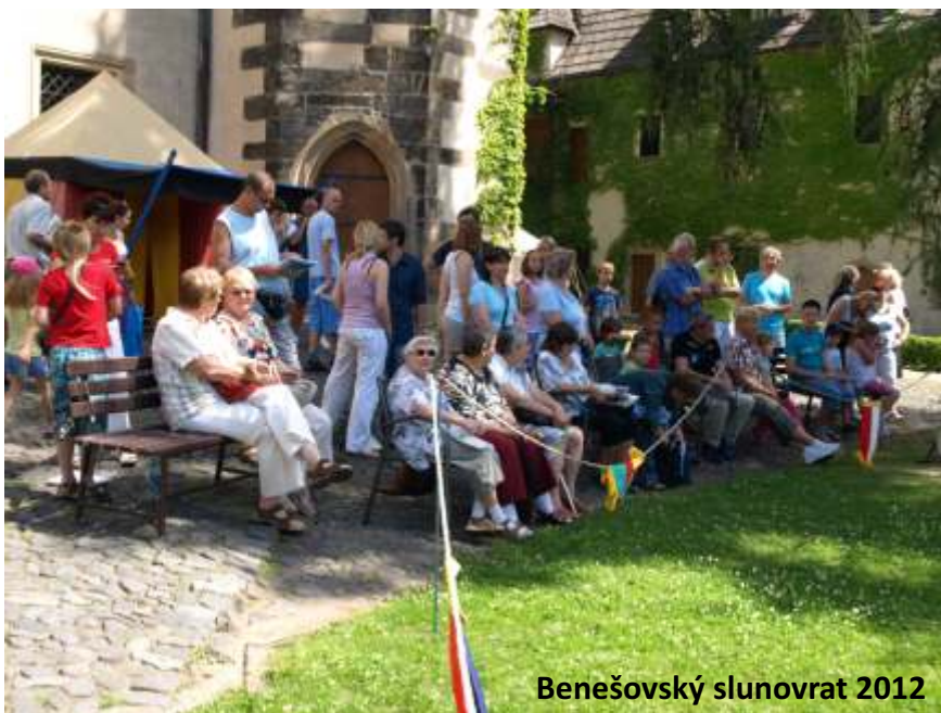
Benešovský slunovrat 2012