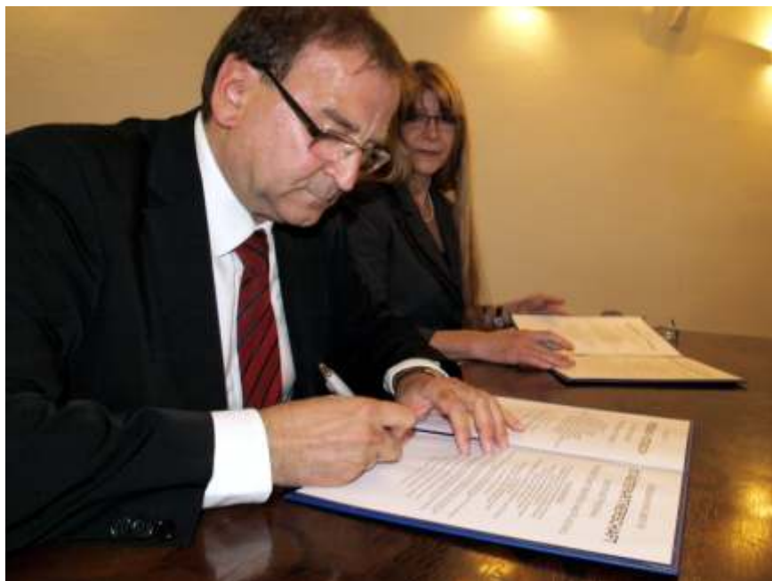
Podpis smlouvy o spolupráci na dalších 5 let.

Prázdniny jsou v plném proudu, vrátím se však na konec školního roku do prostor horního zámku, kde proběhlo slavnostní „vyřazení“ žáků po ukončení povinné školní docházky. Letos poprvé se obřadu účastnily i děti ze speciální školy a bylo velmi dobré vidět, že se slova škarohlídů z loňského roku nepotvrdila. Po začlenění speciální školy do základní nebyly žádné problémy, děti se sžily a výsledek dobré práce benešovských kantorů byl vidět právě na této slavnosti bylo to důstojné a krásné rozloučení. Také